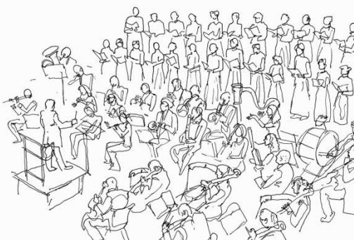
ХОР И ОРКЕСТАР