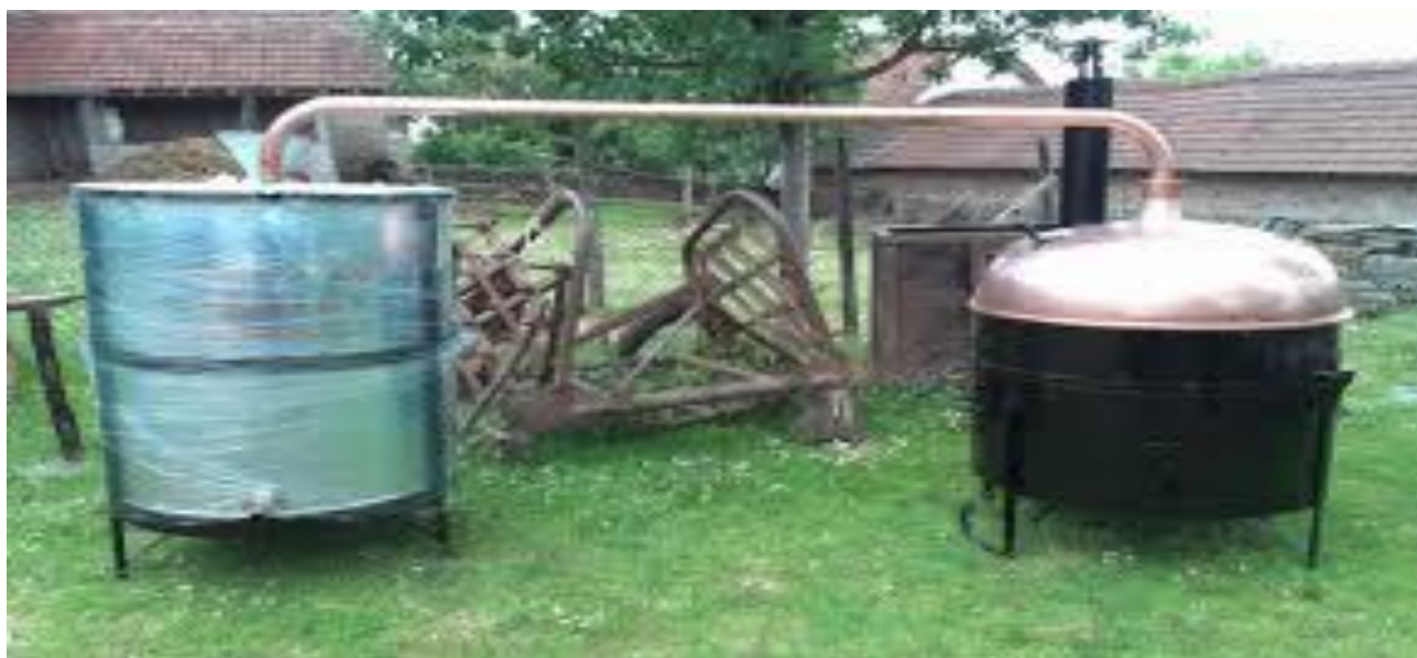
АПАРАТУРА ЗА ПРОИЗВОДЊУ АЛКОХОЛА