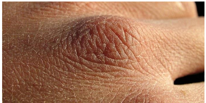
Посна и сува кожа руку