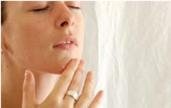
Посна и сува кожа лица

Масни делови су нос и околина носа, средњи део браде, између обрва и средњи део чела