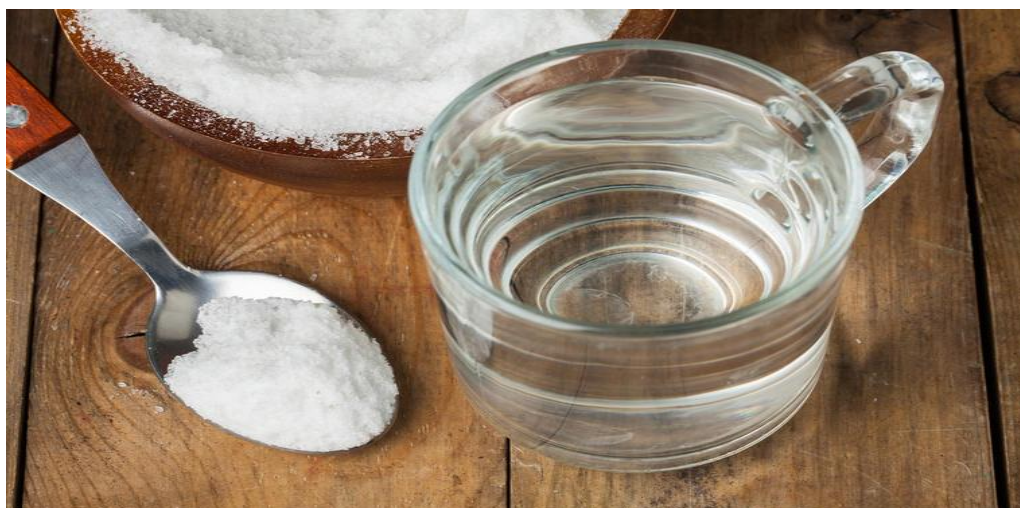
Шећер и вода