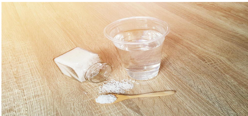
Со и вода