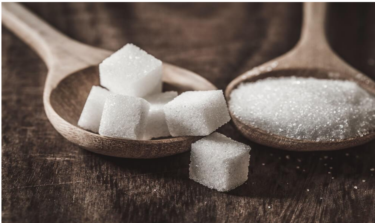
Сахароза – обичан бели шећер