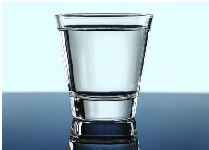
Вода за пиће