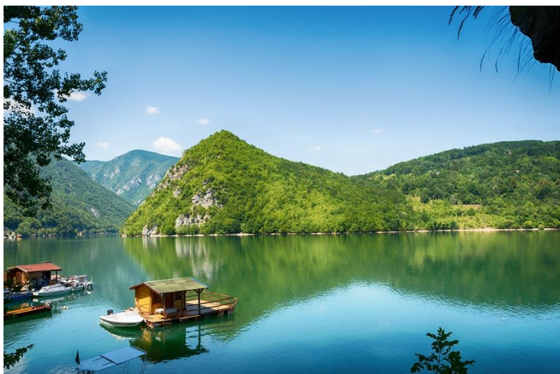
Вода у језерима