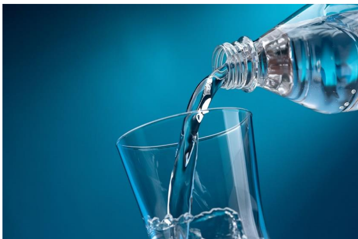
Вода за пиће