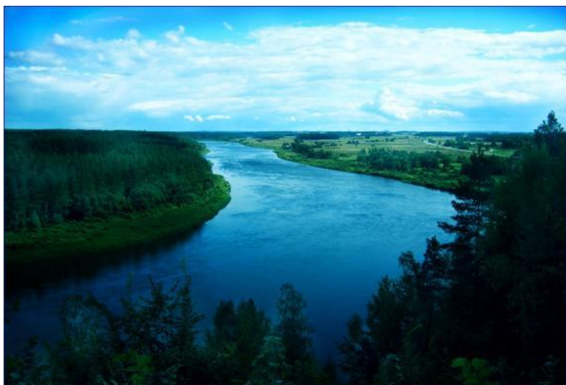
Вода у рекама