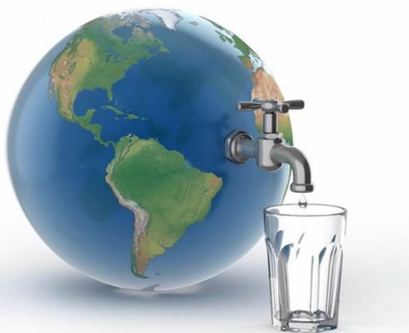
Вода на планети Земљи